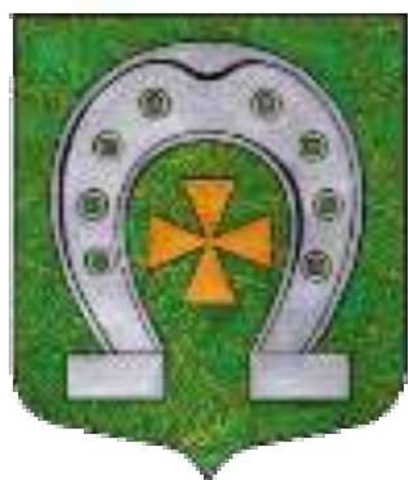
Современный герб МО «Красносельское сельское поселение»

П. Коробицыно и его окрестности имеют интересную историю, тесно связанную с историей и событиями на территории Карельского перешейка, г. Выборга. Это и основание Выборга, и так называемые 4 «шведских века» в нашей истории. Это включение этих земель в состав независимой Финляндии после октябрьских событий 1917 г. Это военные события и связанные с результатами изменения границ. Интересный факт, часть земель Карельского перешейка, включая территорию п. Красносельское, Коробицыно и их окрестностей, являлись собственностью графа Г.П. Чернышёва и его семьи. Он был участником Северной войны, первым комендантом Выборга. Если сравнить родовой герб Чернышёва и современный герб Красносельского сельского поселения, то можно легко уловить сходства.