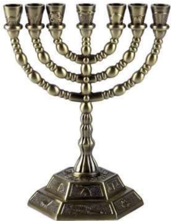
Древний символ иудаизма- семисвечник (Менора)