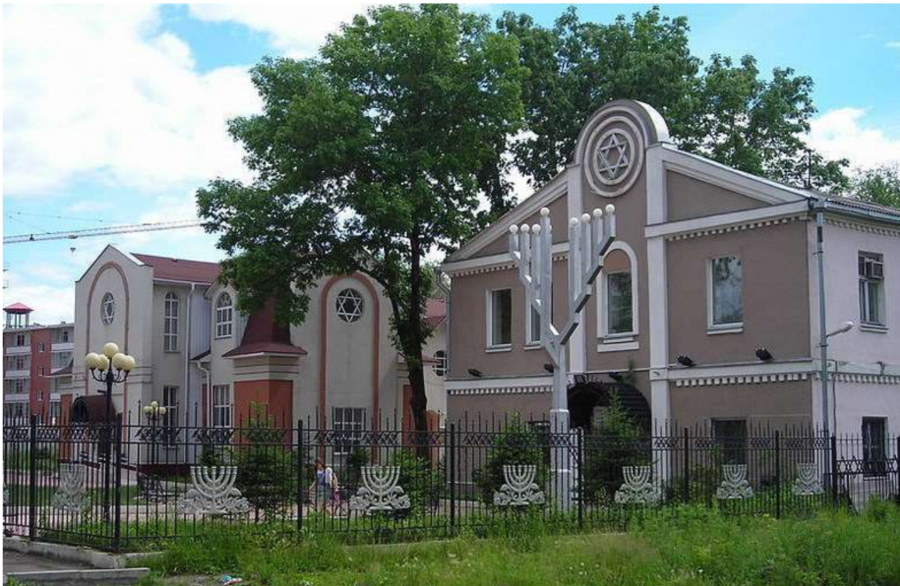
Синагога в Биробиджане